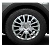
17" okrasni pokrovi 'MIAMI'