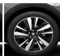
19" ALU platišča 'WASHINGTON'