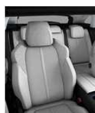
ALLURE TEP & Tkanina 'Evron' 48FR