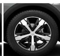
18" ALU platišča 'LOS ANGELES'