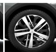
19" ALU platišča 'BOSTON'