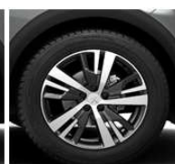
18" ALU platišča 'DETROIT'