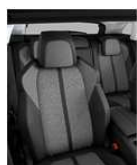
ALLURE TEP & Tkanina 'Piedimonte' 48FX