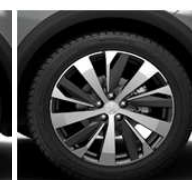
19" ALU platišča 'NEW YORK'