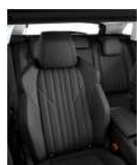
ACTIVE/ALLURE (opcijsko) Usnje 'Claudia' QRFX