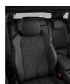
GT TEP & Alcantara OJFH