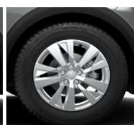
17" ALU platišča 'CHICAGO'