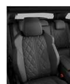
GT (opcijsko) Usnje 'Nappa' 8DFH