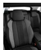
ACCESS/ACTIVE Tkanina 'Meco' 47FX