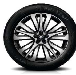
Platišča iz lahke litine 19" Initiale Paris