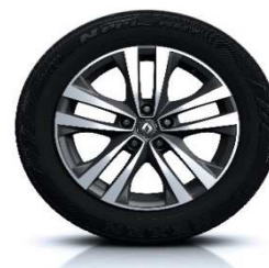
Platišča iz lahke litine 18" Argonaute