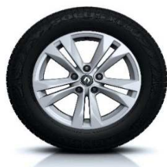
Platišča iz lahke litine 17" Esqis