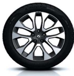
Platišča iz lahke litine 19" Proteus