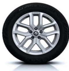
Platišča iz lahke litine 18" Taranis