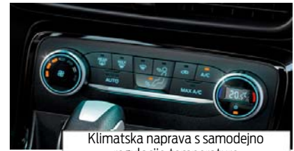
Klimatska naprava s samodejno regulacijo temperature