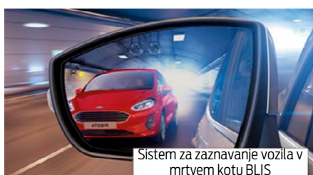
Sistem za zaznavanje vozila v mrtvem kotu BLIS