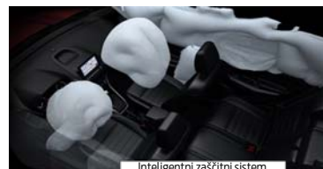
Inteligentni zaščitni sistem

Revolucionarni novi 1,0-litrski 3-valjni bencinski motor EcoBoost vam zagotavlja moč, ki bi jo sicer pričakovali od običajnega 1,6-litrskega motorja, pri tem pa dosega za 24 % manjšo porabo in za 25 % nižje izpuste CO2. Diamantu podobna prevleka na batnih obročkih zmanjšuje trenje; turbopolnilnik, neposredni vbrizg in spremenljiva časovna uskladitev ventilov pa izboljšujejo izkoristek. Rezultat je izjemno varčen motor, ki je že šest let zapored zmagovalac mednarodnih tekmoval