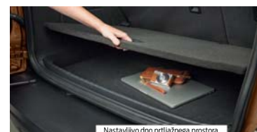
Nastavljivo dno prtljažnega prostora