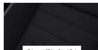
Delno usnje ST-Line Generic Red