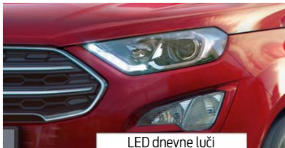
LED dnevne luči