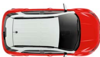
Frozen White barva strehe