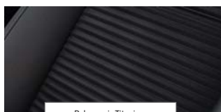
Delno usnje Titanium