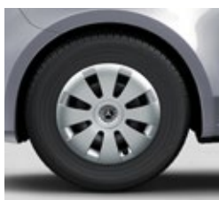
40,6 cm (16") jeklena platišča (RS3)