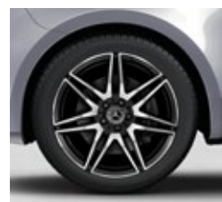
48,3 cm (19") AMG platišča iz lahke kovine (RK4)