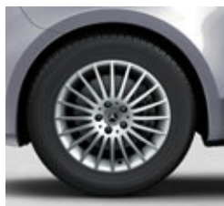
43,2 cm (17") platišča iz lahke kovine (RK8)