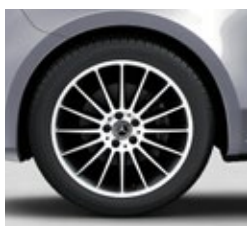
48,3 cm (19") platišča iz lahke kovine (RK3)