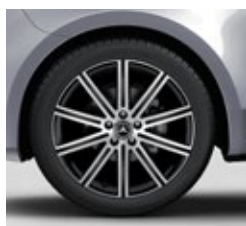
48,3 cm (19") platišča iz lahke kovine (R1Q)