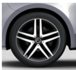
48,3 cm (19") platišča iz lahke kovine (RL3)