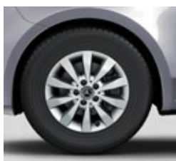
40,6 cm (16") platišča iz lahke kovine (RL5)