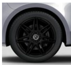
48,3 cm (19") AMG platišča iz lahke kovine (R1U)