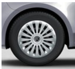
43,2 cm (17") jeklena platišča (RS7)