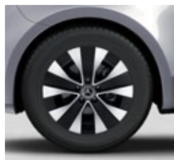
43,2 cm (17") platišča iz lahke kovine (R1N)