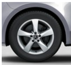
43,2 cm (17") platišča iz lahke kovine (RL8)