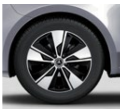
45,7 cm (18") platišča iz lahke kovine (R1P)