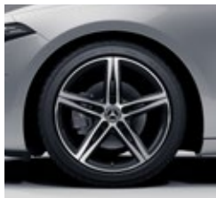
45,7 cm (18") platišča iz lahke kovine (01R)