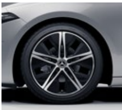
45,7 cm (18") platišča iz lahke kovine (R31)