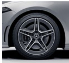
45,7 cm (18") AMG platišča iz lahke kovine (RQS)