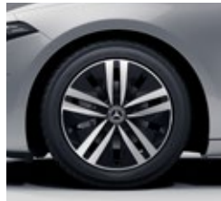
43,2 cm (17") platišča iz lahke kovine (R11)