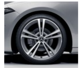
48,3 cm (19") platišča iz lahke kovine (R55)