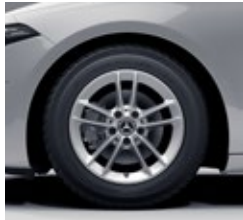
40,6 cm (16") platišča iz lahke kovine (R78)