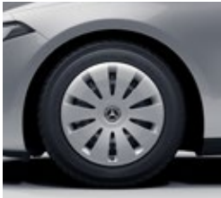
40,6 cm (16") jeklena platišča z okrasnimi pokrovi (R00)