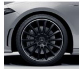
48,3 cm (19") AMG platišča iz lahke kovine (RVL)