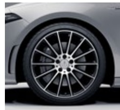
48,3 cm (19") AMG platišča iz lahke kovine (RVH)