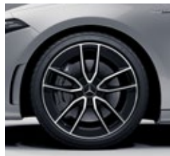
48,3 cm (19") AMG platišča iz lahke kovine (RTI)