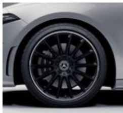
48,3 cm (19") AMG platišča iz lahke kovine (RVK)