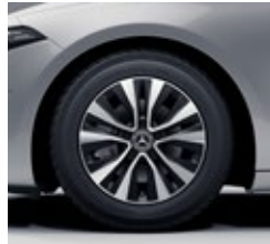
40,6 cm (16") platišča iz lahke kovine (R30)