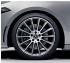
48,3 cm (19") AMG platišča iz lahke kovine (RVG)