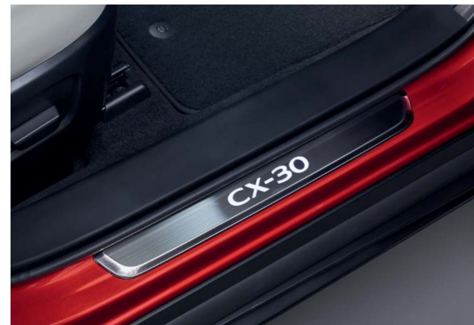
Osvetljeni ščitniki pragov

Mazda je ustvarila dovršeno dodatno opremo, ki brezhibno dopolnjuje vašo Mazdo CX-30. Za popoln seznam originalne dodatne opreme Mazda obiščite spletno stran www.mazda.si/lastniki/dodatna-oprema/