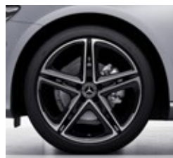
48,3 cm (19") platišča iz lahke kovine (R90)