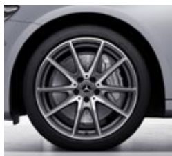
48,3 cm (19") AMG platišča iz lahke kovine (RRD)