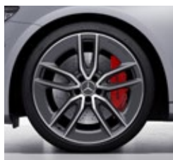
50,8 cm (20") AMG platišča iz lahke kovine (RZT)