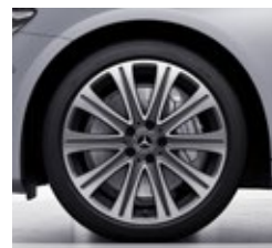
48,3 cm (19") platišča iz lahke kovine (R97)