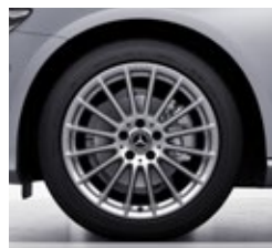
45,7 cm (18") platišča iz lahke kovine (01R)