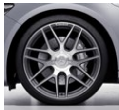
50,8 cm (20") AMG kovana platišča (RTR)