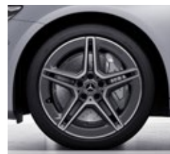
45,7 cm (18") AMG platišča iz lahke kovine (RS)