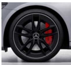
50,8 cm (20") AMG platišča iz lahke kovine (RZS)