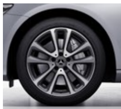
45,7 cm (18") platišča iz lahke kovine (22R)