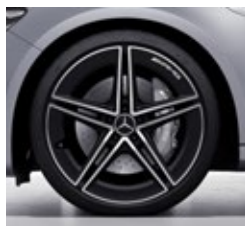
50,8 cm (20") AMG platišča iz lahke kovine (RZX)