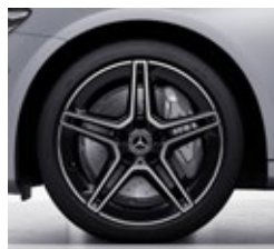
45,7 cm (18") AMG platišča iz lahke kovine (RSP)