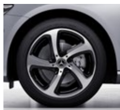
45,7 cm (18") platišča iz lahke kovine (82R)