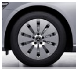
43,2 cm (17") platišča iz lahke kovine (25R)