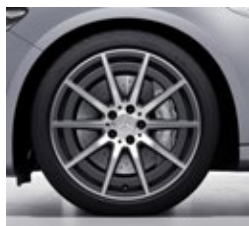
48,3 cm (19") AMG platišča iz lahke kovine (RRC)