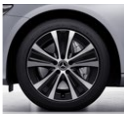
45,7 cm (18") platišča iz lahke kovine (52R)