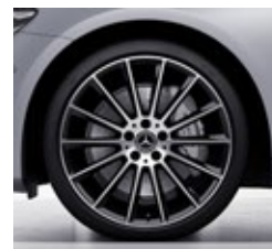
50,8 cm (20") AMG platišča iz lahke kovine (RVR)