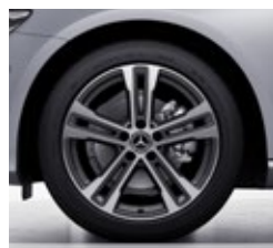
45,7 cm (18") platišča iz lahke kovine (01R)