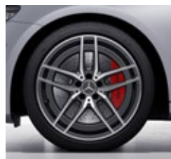
48,3 cm (19") AMG platišča iz lahke kovine (RTA)