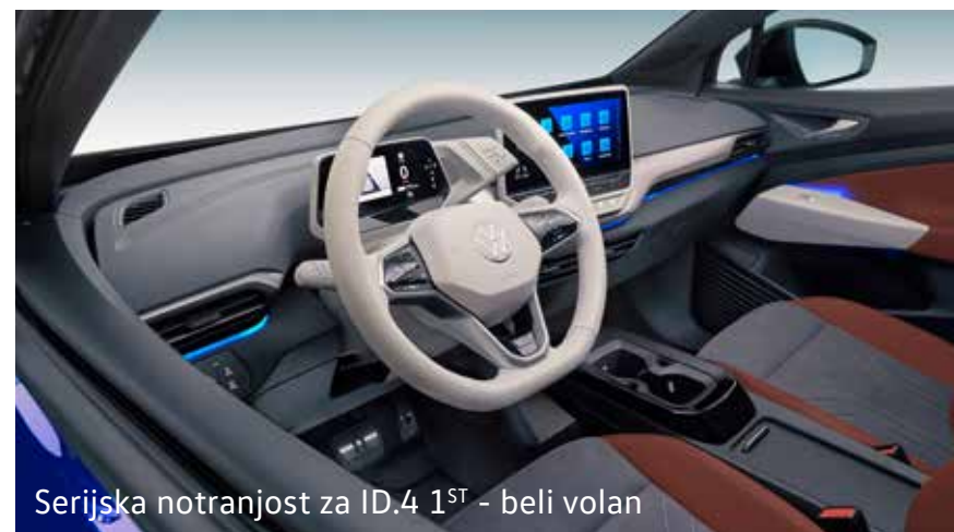
Serijska notranjost za ID.4 1 ST - beli volan

Serijsko platišča za ID.4 1st Max 21" aluminijasta platišča »Narvik«, 8,5J x 21 spredaj, 9J x 21 zadaj. Pnevmatike: 235/45 R21 spredaj, 255/40 R21 zadaj