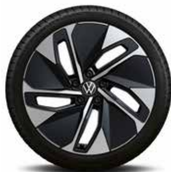
19-palčno aluminijasto platišče Hamar, črno DO