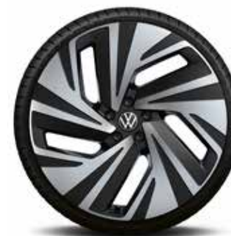
21-palčno aluminijasto platišče Narvik DO

Slike na teh straneh naj služijo le za orientacijo, saj tiskarski postopki ne omogočajo resnične reprodukcije sedežnih prevlek, lakov in platišč.