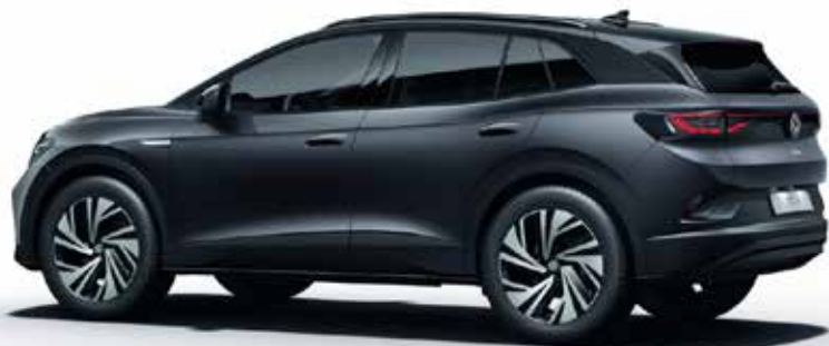
Manganovo siva , kovinski lak 5VA1