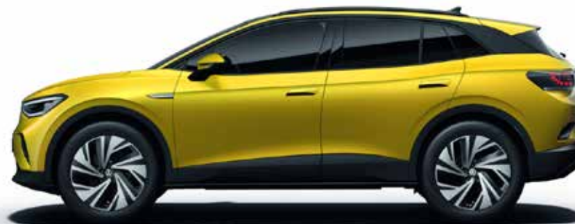
Medeno rumena , kovinski lak G8A1