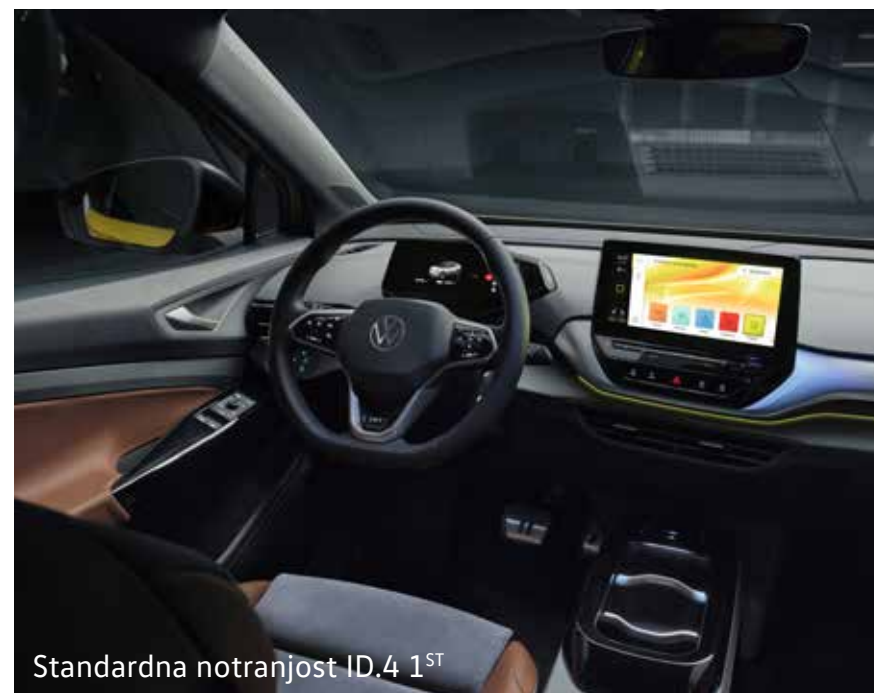
Standardna notranjost ID.4 1 ST