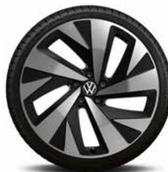
20-palčno aluminijasto platišče Drammen DO