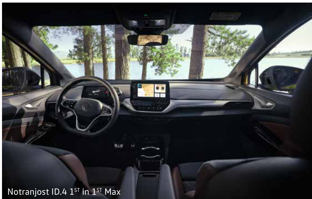
Notranjost ID.4 1 ST in 1 ST Max