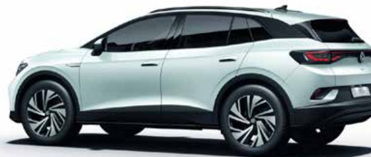
Ledeniško bela , kovinski lak 2YA1