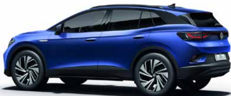
Senčno modra , kovinski lak 2PA1