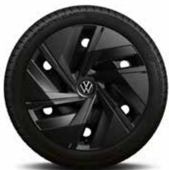
18-palčno jekleno platišče S