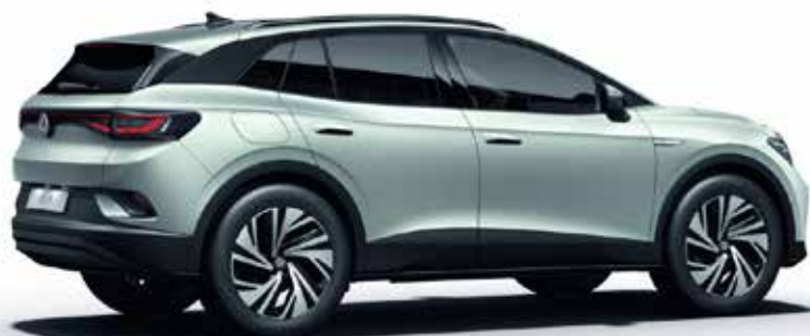
Luskasto srebrna , kovinski lak 1T