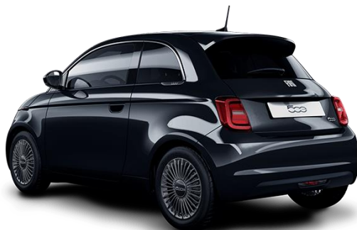
Črna - Onyx Black (pastelna barva) barva: 601, opcija: 10N