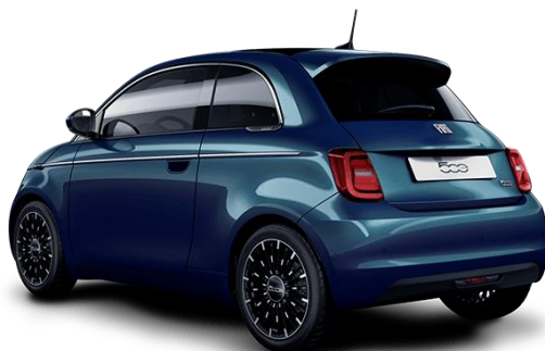
Zelena - Ocean Green (kovinska barva) barva: 230, opcija: 5CE