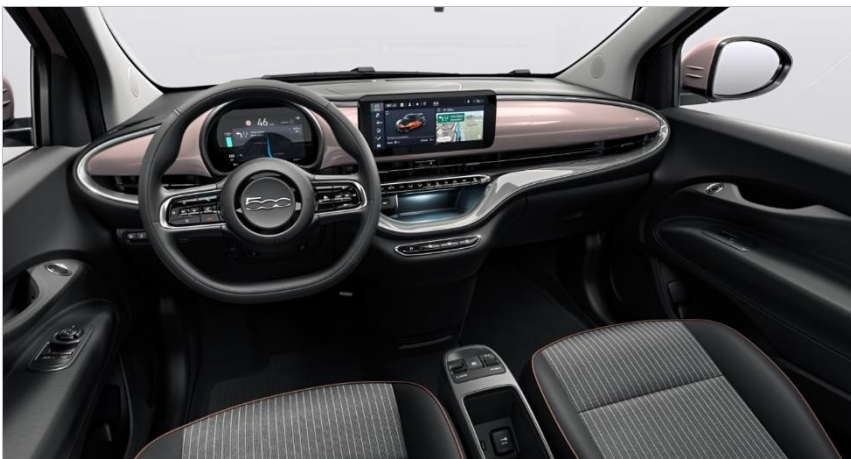
Črna-siva Sequal™ tkanina z rjavo obrobo