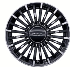
Lita platišča R17 Diamond (205/45 R17)