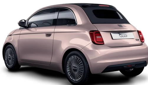
Zlata - Rose Gold (kovinska barva) barva: 237, opcija: 5CF