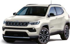
Slonokoščena Ivory (biserna barva) (020/ opc. 6FX) - (776/ opc. 05C)*