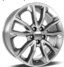
225/55 R18 235/55 R18 (PHEV)