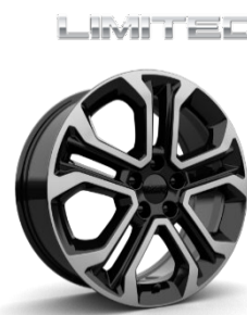
225/55 R18 235/55 R18 (PHEV)