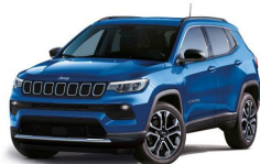
Modra Italia (kovinska barva) (018/ opc. 5CH) - (737/ opc. 0Q0)*