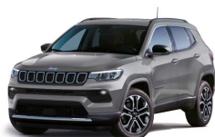
Siva Sting (pastelna barva) (503/ opc. 8CZ) - (264/ opc. 0Q1)*