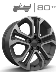
225/55 R18 235/55 R18 (PHEV)