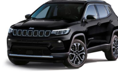
Črna Carbon (kovinska barva) (876/ opc. 5CE)