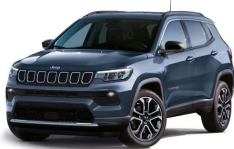
Modra Shade (kovinska barva) (435/ opc. 5XZ) - (263/ opc. 0UX)*