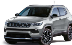
Siva Billet (kovinska barva) (348/ opc. 5DN) - (738/ opc. 5FA)*