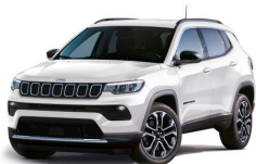
Bela Alpine (pastelna barva) (296/ opc. 5CA) - (317/ opc. 6Y0)*