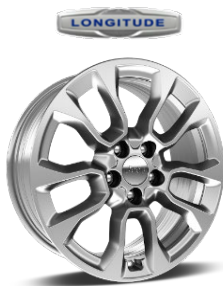
215/60 R17 235/60 R17 (PHEV)