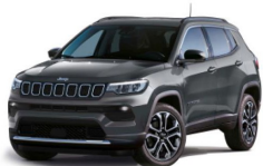
Siva Graphite (kovinska barva) (679/ opc. 5DT) - (170/ opc. 5EZ)*