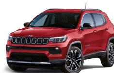
Rdeča Colorado (pastelna barva) (176/ opc. 5CJ) - (686/ opc. 05E)*