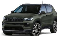
Zelena Urban / črna streha (matirana barva) (225/ opc. 6Y2)