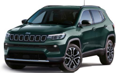
Zelena Techno (kovinska barva) (019/ opc. 61Q) - (749/ opc. 05B)*