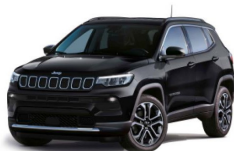
Črna (pastelna barva) (601/ opc. 5CK)