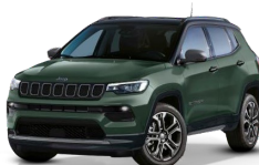
Zelena Mimetic / črna streha (matirana barva) (781/ opc. 4DL)

* - koda za barvo v kombinaciji s črno streho