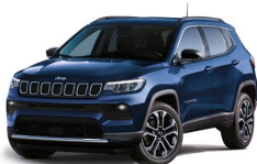
Modra Jetset (kovinska barva) (888/ opc. 5DP) - (100/ opc. 6WS)*