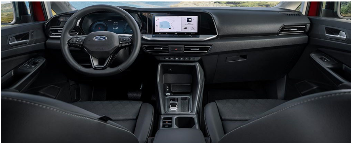
Slika prikazuje notranjost nivoja opreme Active z opcijskim Avdio sistemom 6

AGR - kampanja za zdrav hrbet - Tourneo Connect ima za doplačilo na voljo sedeže s certifikatom kampanje AGR