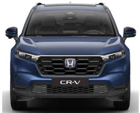
Modra Canyon River – kovinska