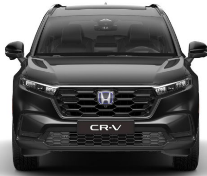
Črna Crystal – biserna