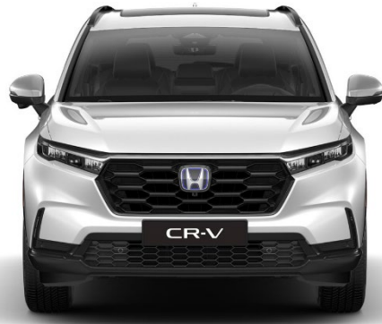
Bela Platinum – Biserna