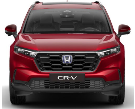
Rdeča Crystal – kovinska