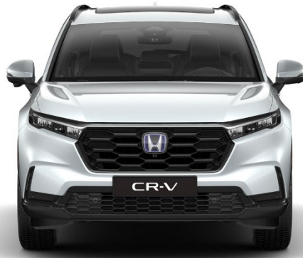
Siva Diamond Dust – biserna