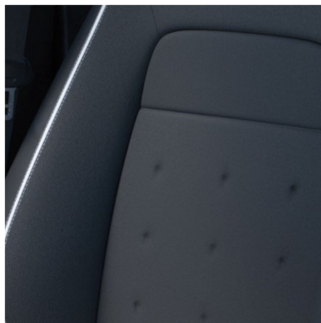
Kombinacija usnje/tkanina - za Sport