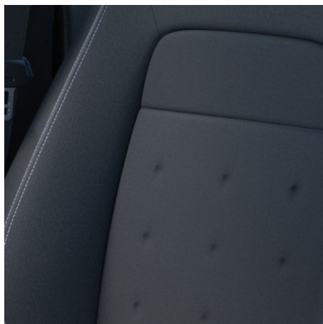
Črna tkanina – za Elegance