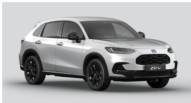
Siva Diamond Dust – biserna