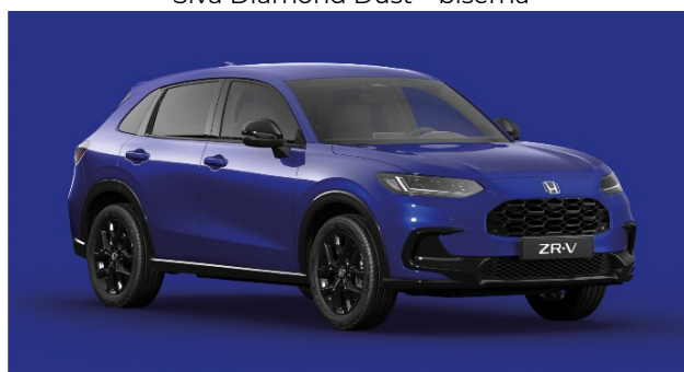
Modra Still Night – biserna