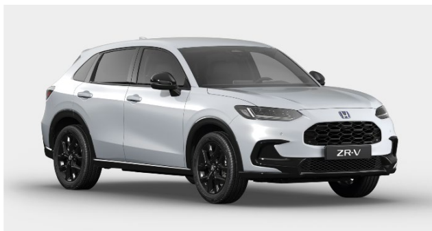
Bela Platinum – Biserna