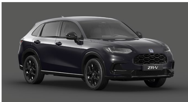
Črna Ruse – kovinska