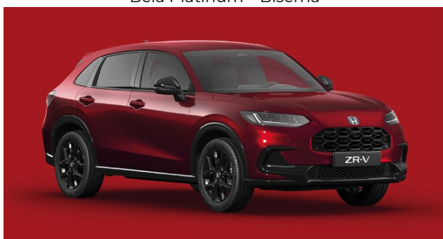
Rdeča Radiant – kovinska