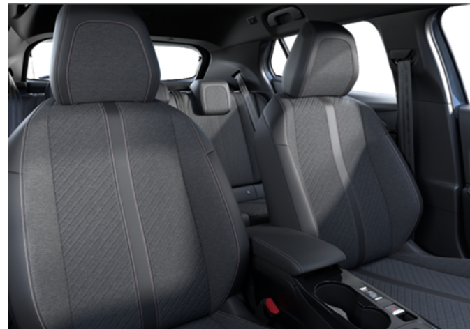
AQFX - Kombinaciji TEP usnja in tkanine Lomsa serijsko na Allure