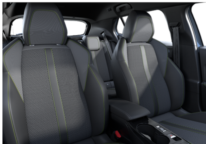
ATFX - Kombinaciji TEP usnja in tkanine Belomka serijsko na GT