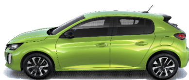
EQM0 - RUMENA AGUENDA