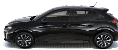
9VM0 - ČRNA PERLA NERA