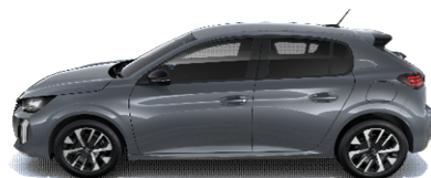
LDM0 - SIVA SELENIUM