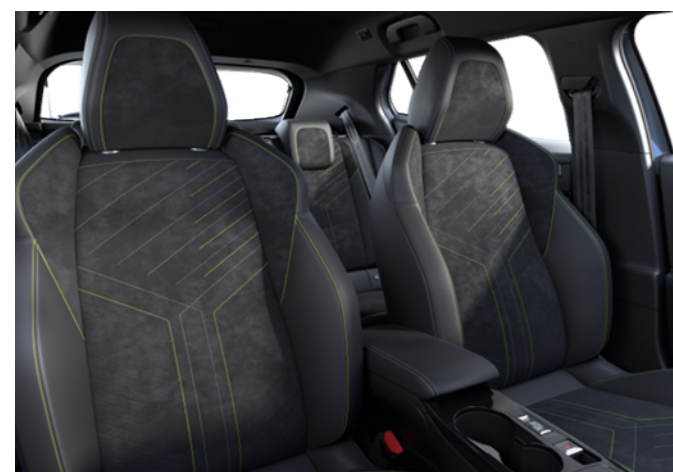
WNFX - Kombinaciji TEP usnja in alkantare opcija na GT