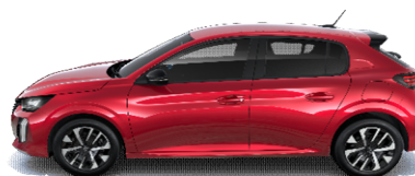
VHM5 - RDEČA ELIXIR