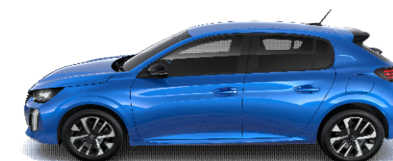
SMM6 - MODRA VERTIGO