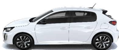
WPP0 - BELA BANQUISE