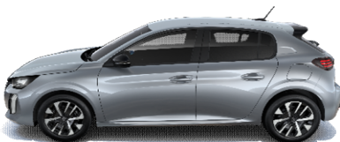
F4M0 - SIVA ARTENSE