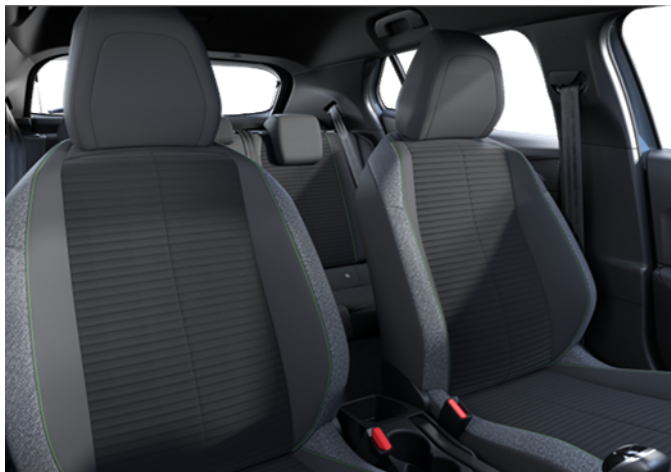
APFX - Tkanina Pneuma serijsko na Active