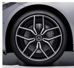
48,3 cm (19") AMG platišča iz lahke kovine (RVD)