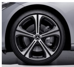
48,3 cm (19") platišča iz lahke kovine (R82)