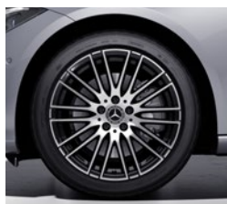
45,7 cm (18") platišča iz lahke kovine (R86)