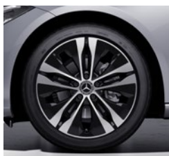
45,7 cm (18") platišča iz lahke kovine (R87)