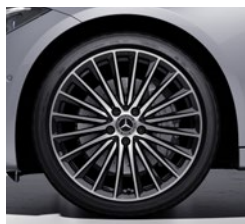
48,3 cm (19") AMG platišča iz lahke kovine (RVC)