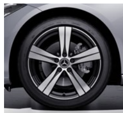
45,7 cm (18") platišča iz lahke kovine (R32)