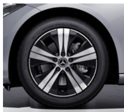
43,2 cm (17") platišča iz lahke kovine (R69)