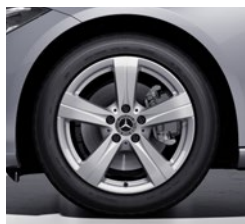
43,2 cm (17") platišča iz lahke kovine (R24)