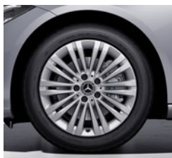
43,2 cm (17") platišča iz lahke kovine (R15)