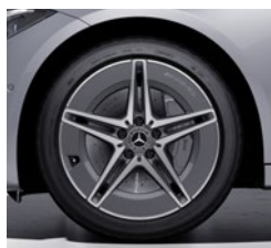
45,7 cm (18") AMG platišča iz lahke kovine (RSJ)