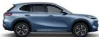
GLACIER BLUE (H30)