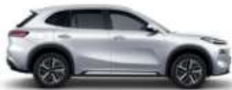
ALPINE WHITE (H32)