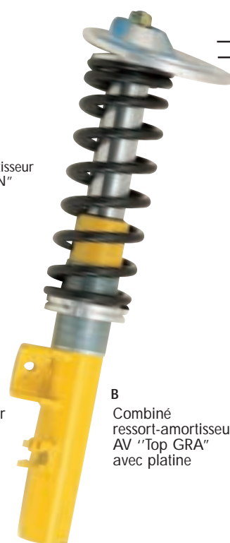
B Combiné ressort-amortisseur AV "Top GRA" avec platine